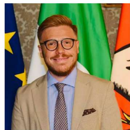
ISMAELE LA VARDERA POLITICO E GIORNALISTA