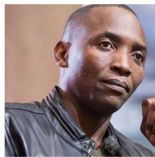
ABOUBAKAR SOUMAHORO SINDACALISTA E POLITICO ITALIANO