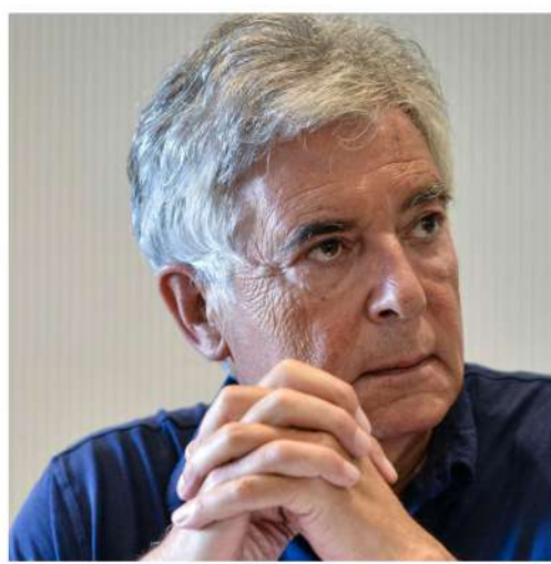
CLAUDIO MARTELLI DIRETTORE DEL GIORNALE AVANTI EX VICE PRESIDENTE DEL CONSIGLIO DEI MINISTRI