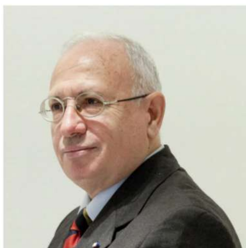
FABIO MINI GENERALE DI CORPO D'ARMATA CAPO DI STATO MAGGIORE DEL COMANDO NATO