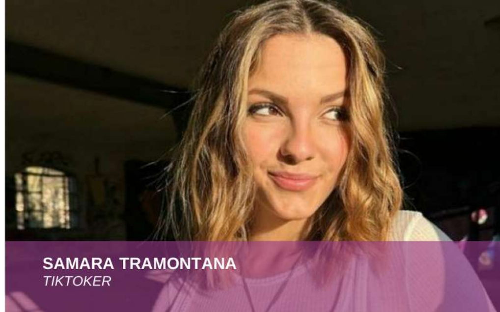
SAMARA TRAMONTANA TIKTOKER