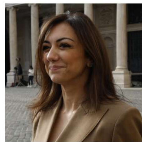
AUGUSTA MONTARULI POLITICA