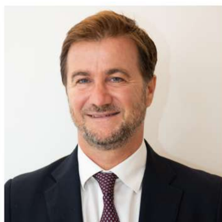
MARCO DE GIORGI CONSIGLIERE DI RUOLO DELLA PRESIDENZA DEL CONSIGLIO DEI MINISTRI